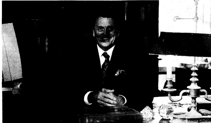
El escritor Spencer Johnson, en su despacho.

-¿Este éxito ha cambiado su vida? -Sí y no. Sí, en el sentido de que me ha dado más energía, ya que es muy bueno ayudar a gente que no conozco. Y no, por algo que tengo claro. He visto demasiadas vidas de personas con éxito deterioradas. Por eso, es importante determinar qué tiene que cambiar y qué no. Si no conservas los pies en el suelo, puedes perder tus valores. Es uno de los motivos por los que no pongo mi foto en los libros y no me he vuelto famoso. La fama